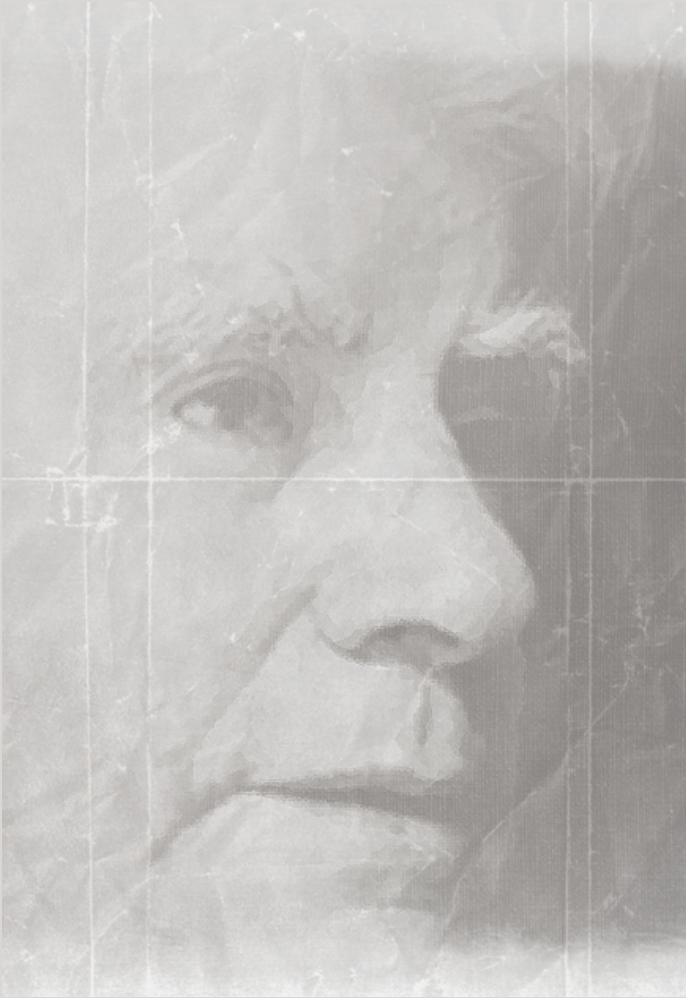
IMAGEN DE LEOPOLDO ZEA